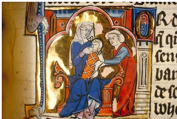
Reine et mère (Elaine allaitant Lancelot)